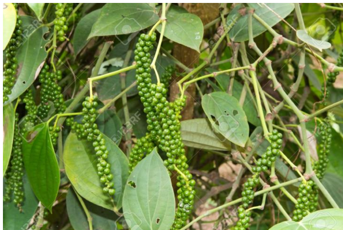
Figura 1. Árbol de pimienta negra

La Organización de las Naciones Unidas para la Alimentación y la Agricultura (FAO) señaló que la pimienta proviene de la familia de las piperáceas, su origen es de la India, aunque se encuentra de manera silvestre en los bosques tropicales de América. Los frutos tienen forma de racimo verde.