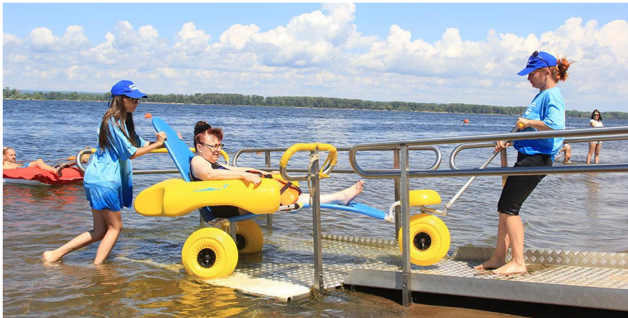
Figura 6. Sillas anfibias y personal de apoyo en una playa accesible.