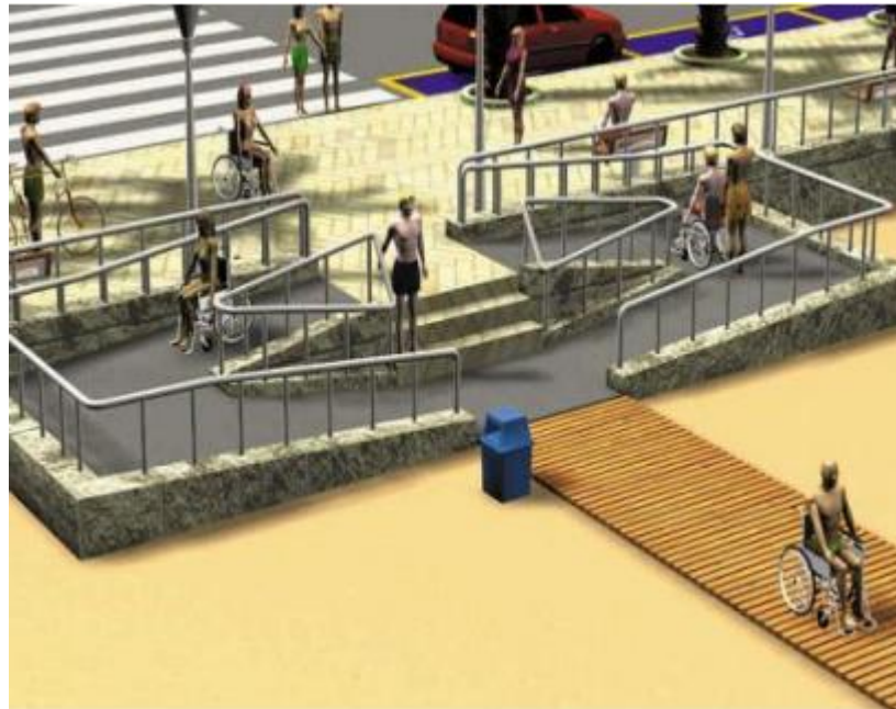
Figura 4. Rampas de acceso a la playa con caminera de madera para personas con discapacidad.