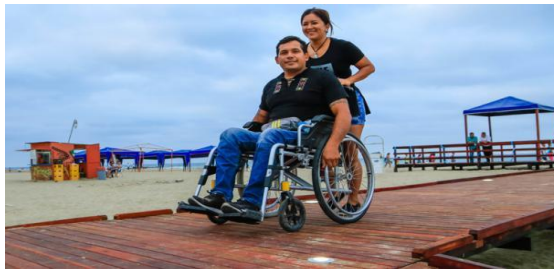
Figura 2. Playa accesibles localizada en Las Palmas – Cantón Esmeraldas

En la provincia de Esmeraldas, se ha desarrollado ya el proyecto de “Playas Accesible” financiado por el Municipio del cantón como una respuesta a las necesidades de personas con discapacidad y movilidad reducida, de acceder de manera independiente y sin limitaciones al disfrute de un espacio natural. En el marco de este proyecto, se prevé la adquisición de equipos para la implementación del “Balneario Accesible”.