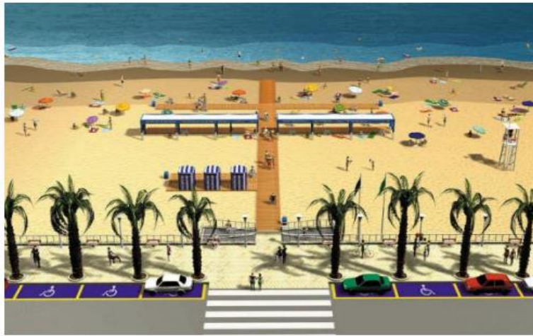
Figura 3. Diseño de una playa accesible con elementos y espacios para personas con discapacidad.