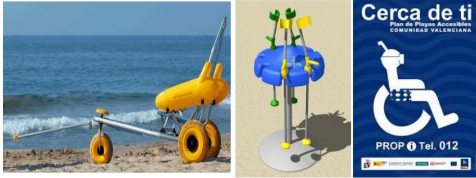
Figura 5. Sillas anfibias, muletas para arena y rótulos de playas accesibles.