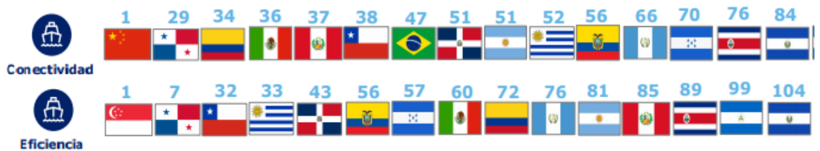
Figura 2. Competitividad Global-Infraestructura Portuaria Tomado de Reporte Global de Competitividad 2018-2019 ; Deloitte (2018).

En lo que respecta al ámbito aduanero, en específico la infraestructura portuaria, se pudo conocer que la conectividad a la red marítima global del país estuvo en el puesto 56, en este aspecto el país fue superado por los países de Colombia, Perú, Chile, Brasil, Argentina y Uruguay, que son parte de Suramérica. En cambio, en el componente de eficiencia de servicios portuarios el Ecuador estuvo en el puesto 72, quedando por debajo de Chile y Argentina que pertenecen a América del Sur como se aprecia en la figura 2.