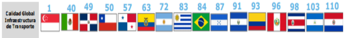
Figura 1. Competitividad Global: Infraestructura Transporte Tomado de Reporte Global de Competitividad 2018-2019 ; Deloitte (2018).

En lo que respecta al ámbito aduanero, en específico la infraestructura portuaria, se pudo conocer que la conectividad a la red marítima global del país estuvo en el puesto 56, en este aspecto el país fue superado por los países de Colombia, Perú, Chile, Brasil, Argentina y Uruguay, que son parte de Suramérica. En cambio, en el componente de eficiencia de servicios portuarios el Ecuador estuvo en el puesto 72, quedando por debajo de Chile y Argentina que pertenecen a América del Sur como se aprecia en la figura 2.