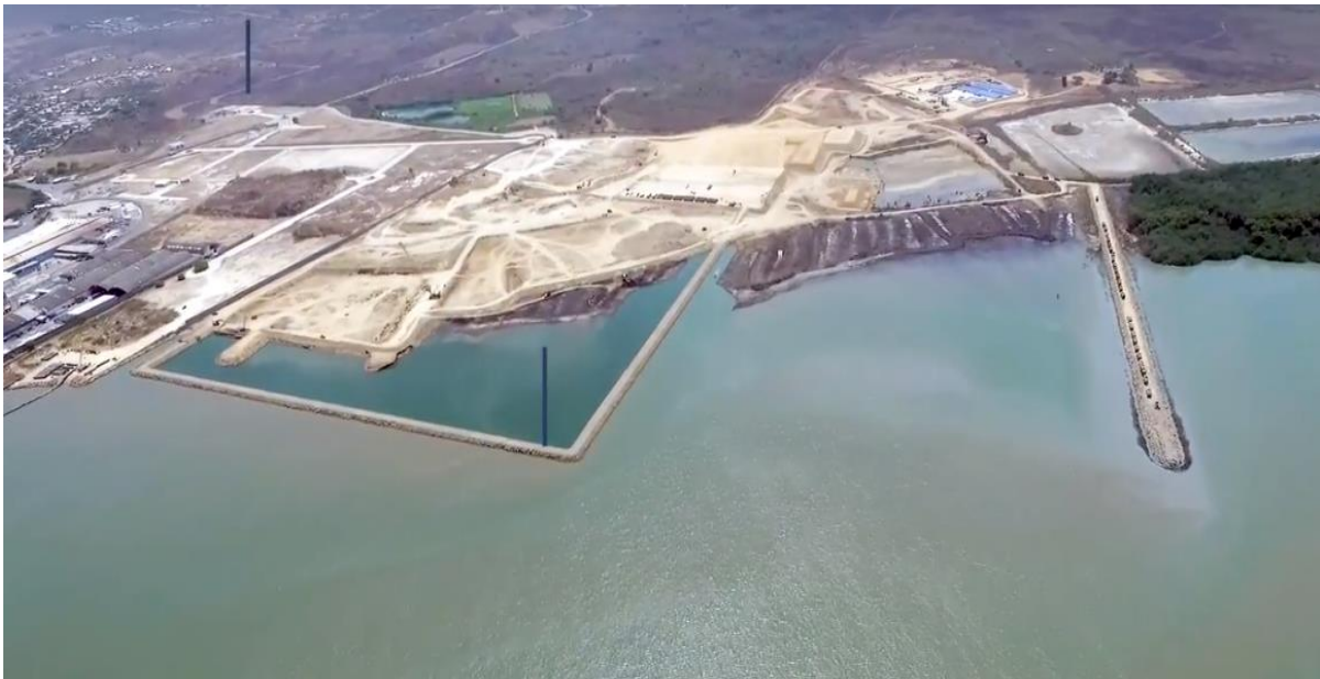
Figura 1. Avances fase 1 de Puerto de Aguas Profundas de Posorja

El puerto de Posorja nace de la necesidad de una nueva alternativa con un proyecto muy importante para el país que esperamos que en tres años pueda recibir buques Post-Panamax por lo que los puertos de Guayaquil no tendrían por qué desaparecer, pero esta es una interrogante que queda abierta hasta cuando ya esté en funcionamiento el nuevo puerto. (El Telégrafo, 2016)