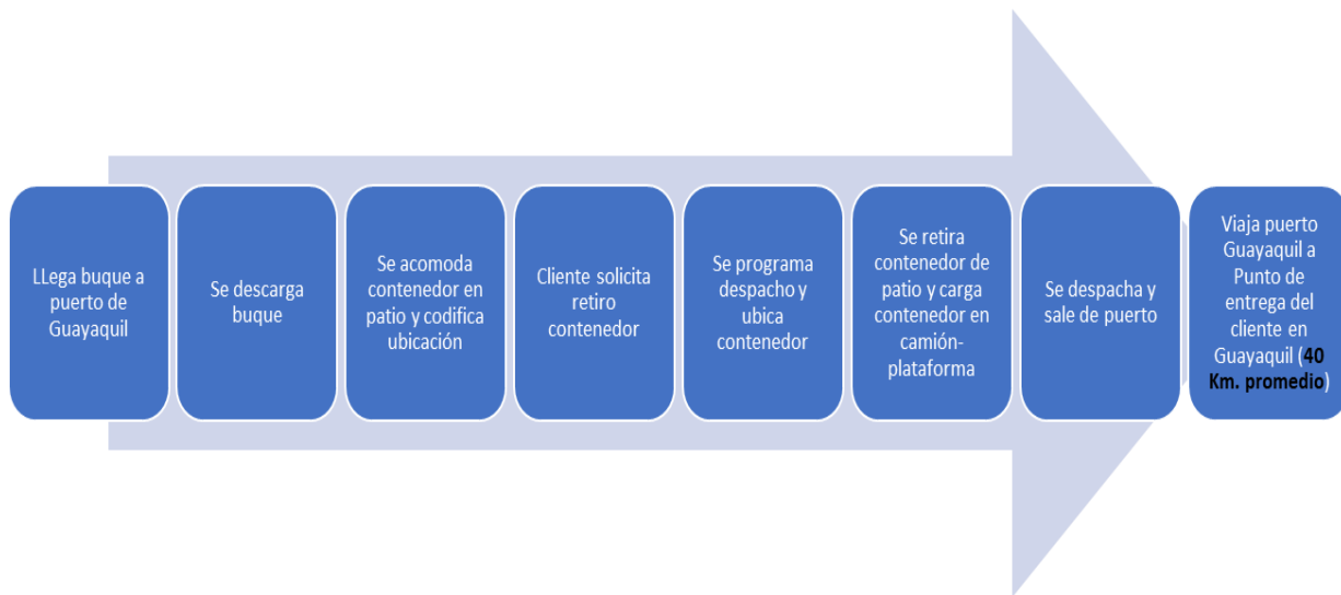
Figura 3. Comparativo flujograma operativo

Ilustración grafica que compara los procesos operativos de recepcion y despacho de contenedores en los puertos de Guayaquil.