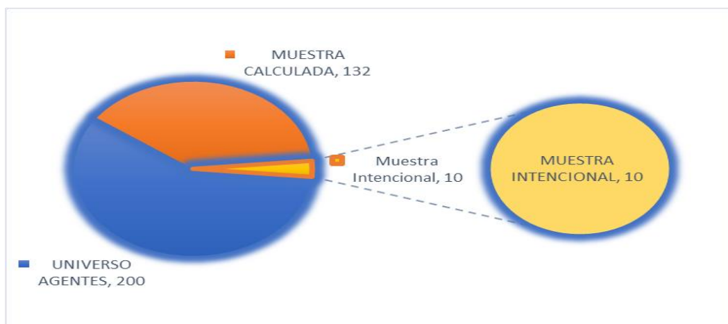
Figura 2. Cálculo de la muestra

Según la página de Aduana del Ecuador existen 200 agentes afianzados de aduana y auxiliares en Guayaquil, (www.aduana.gob.ec, 2017) por lo que la muestra estadística a tomar considerando un margen de confianza del 95% y un margen de error del 5% sería 132 agentes, pero debido a su trabajo en campo casi el 100% del tiempo, se tomó una muestra intencional de 10 personas, que son a las que se pudo acceder.