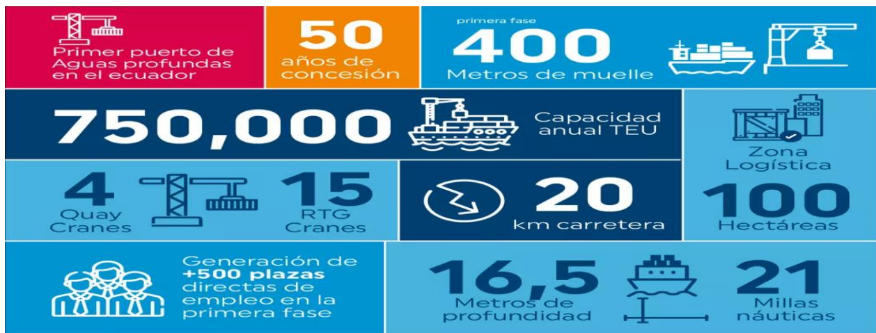
Figura 5 Infografía del puerto de aguas profundas de Posorja

Es importante recalcar la capacidad instalada en la primera fase del puerto de aguas profundas de Posorja, que es de 750.000 TEUS, tendrá una carretera exclusiva de 20 kilómetros lo cual garantizará el ingreso y salida de contenedores sin inconvenientes, junto a este habrá una disponibilidad de 100 hectáreas como zona logística para almacenaje y procesos logísticos, obviamente lo que más resalta es la profundidad de los accesos en el mar que tienen 16.5 metros.