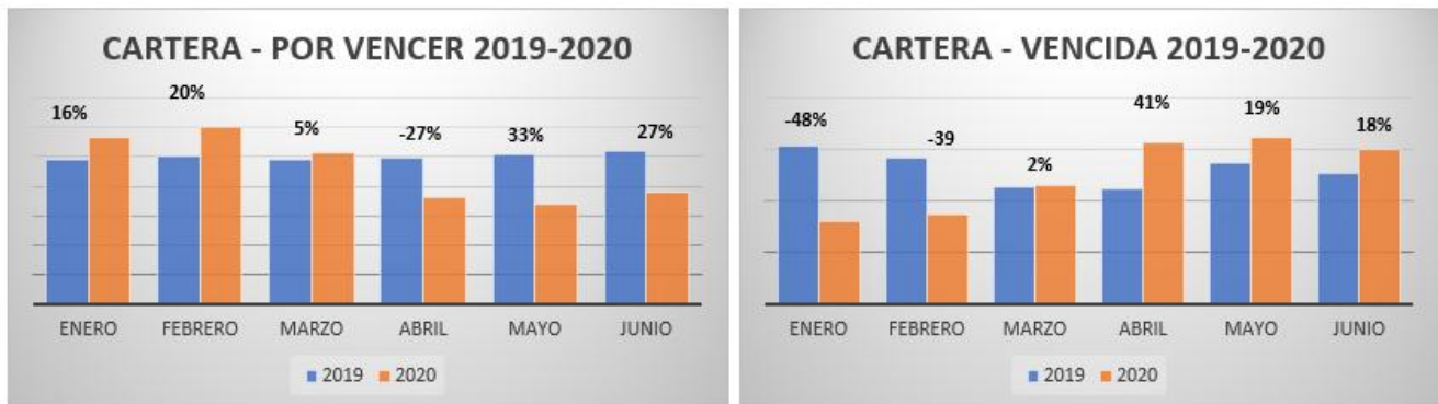
Gráfico 3. Comparativo Cartera por vencer y vencido 2019 -2020

en el Ecuador por lo que la empresa optó por la suspensión con sueldo de cierto personal y la toma de vacaciones del casi 90% del área comercial esto influyó en el cumplimiento de ventas con respecto a cobros donde se encontraban rubros más fuertes eran los Gobiernos Autónomos descentralizados (GAD), compañías entre otras entidades que no estaban laborando ni un 50% de su capacidad.