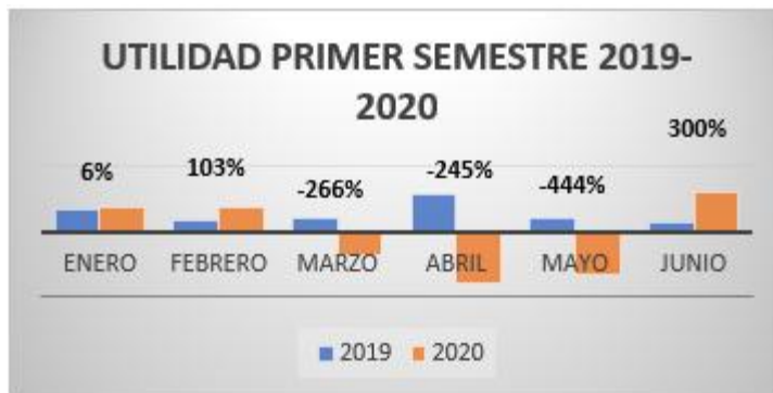
Gráfico 5. Comparativo Utilidad Primer Semestre 2019-2020

En base a (Ega Futura Nube, 2020) “una comisión es una ganancia extra que obtiene una empresa, vendedor o profesional por los servicios que ofrece.” En este caso nos referimos a las comisiones por ventas generadas. Acorde al grafico 4 se observa en enero y febrero del 2020 un incremento en comisiones dado al crecimiento de las ventas por otro lado al iniciar la pandemia las comisiones pagadas decrecen, en el mes de abril se puede visualizar que las comisiones internas en el 2020 son mayores a las comisiones externas esto quiere decir que el equipo comercial pudo realizar más ventas que aquellos vendedores externos a medida que los meses pasan se puede notar como el rubro de comisiones externas sobrepasan a las comisiones pagadas al equipo comercial. En el primer trimestre del 2020 existe una variación promedio de más del 214% en pago de comisiones afectando al costo de ventas, este costo va directamente proporcional a las ventas generadas por lo que se observa en el gráfico 4 que en los meses de cuarentena ha existido una disminución tanto en costo de ventas del 27% y gastos totales del 9% pero a pesar de que los costos, gastos o comisiones hayan disminuido siguen siendo rubros representativos en el costo de ventas que la compañía debe asumir.