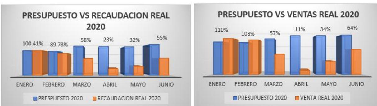
Gráfico 2. Comparativo presupuesto de ventas/cobros vs lo real 2020