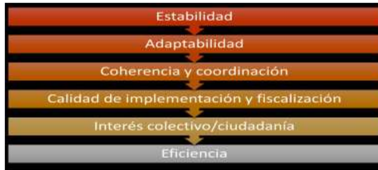
Figura 1 Características Políticas Públicas

Tomado de Material Universidad Tecnológica de Guayaquil (Unidad 1- Materia: Políticas Públicas – Maestría: Administración Pública, Ing. Virginia Zambrano. MBA AUTORA DEL CONTENIDO)