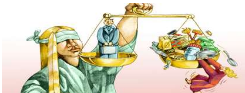
Figura 5 .Brecha salarial entre hombres y mujeres