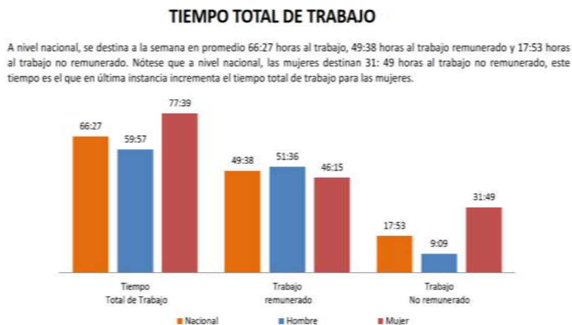
Figura 6. Encuesta Específica del Uso del Tiempo del año 2012. Ecuador

Como se puede apreciar, las mujeres tienen problemas para la armonización de la vida laboral y familiar, debido al pensamiento patriarcal y división sexual de los roles, la incorporación de la mujer al trabajo infiere en una doble jornada como en estos casos donde la corresponsabilidad es casi imposible (VILLARREAL, 2018, p.116).