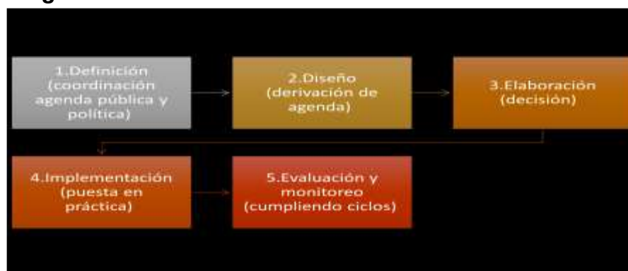
Figura 2 Proceso de Formulación de Políticas Públicas

Tomado de Material Universidad Tecnológica de Guayaquil (Unidad 1- Materia: Políticas Públicas – Maestría: Administración Pública, Ing. Virginia Zambrano. MBA AUTORA DEL CONTENIDO)