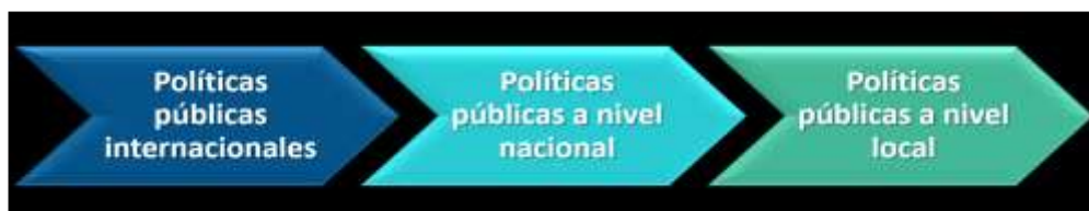
Figura 4 Niveles de Implementación de Políticas Públicas